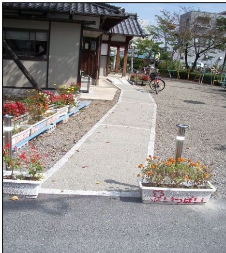
梅田会館に車椅子でも来られるように道路から会館入り口までアプローチ舗装をしました

今後の予定 11月 8日(水) すこやかサロン 12月 3日(日) 町内一斉清掃 12月25日(月)～ 年末夜警