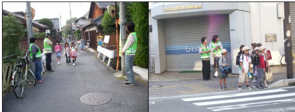
小学生の下校時間帯に立ち番を行うこととなり、6月25日から実施しています。場所は開運会館前(月・木曜)と、びわこ銀行守山駅支店前(火・金曜)です。