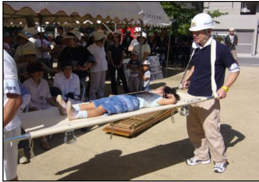
9月4日(日)に梅田町の防災訓練が実施されました。参加者約240名

大津の町に残る築百年の町家を認識し、町の活性化と町づくりのために町家の活用保存を目的に発足した市民団体です。